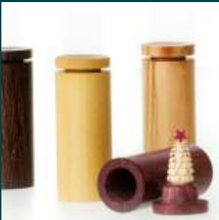
alle Bilder von Ausstellern aus diesem Jahr